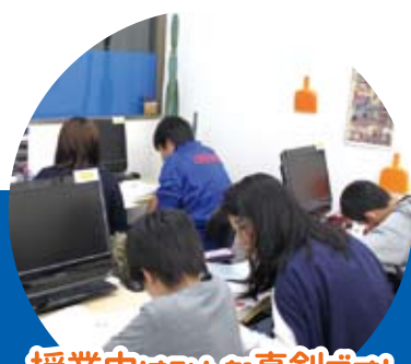
授業中はみんな真剣です！ 徹底した反復学習を行います。