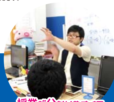
授業が分かりやすくて 楽しいです！