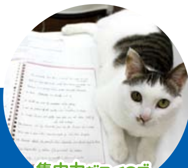
集中力がつくので、 家でもしっかり勉強できます！