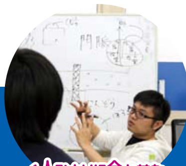
1人ひとりに合わせた 指導をしています！