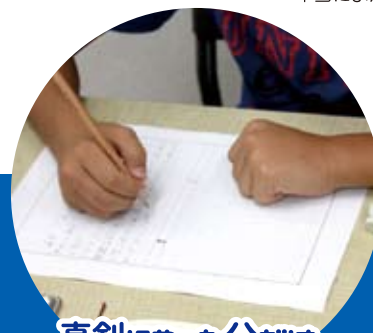
真剣にやった分だけ、 結果がついてきます！