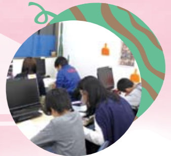
真剣にやった分だけ、結果がついてきます!