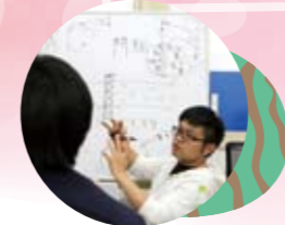
1人ひとりに合わせた指導をしています!