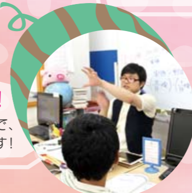
授業が分かりやすく楽しいです!