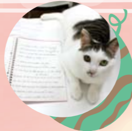
集中力がついたので、家でもしっかり勉強できます!